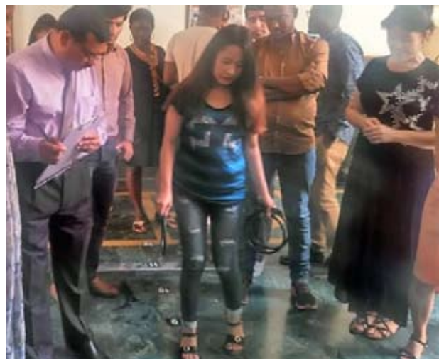
संस्थान के अन्तर्राष्ट्रीय प्रतिभागी, उद्यमिता अभिप्रेरणा अभ्यास, रिंग टॉस, करते हुए

भारतीय समाज के विभिन्न वर्गों के मध्य उद्यमिता के विकास में विविध अनुभवों का आदान—प्रदान करने का एक अनूठा अवसर भी प्रदान किया। इन कार्यक्रमों को विदेश—मंत्रालय के भारतीय तकनीकी एवं आर्थिक सहयोग (आईटीईसी) के अन्तर्गत प्रायोजित किया गया।