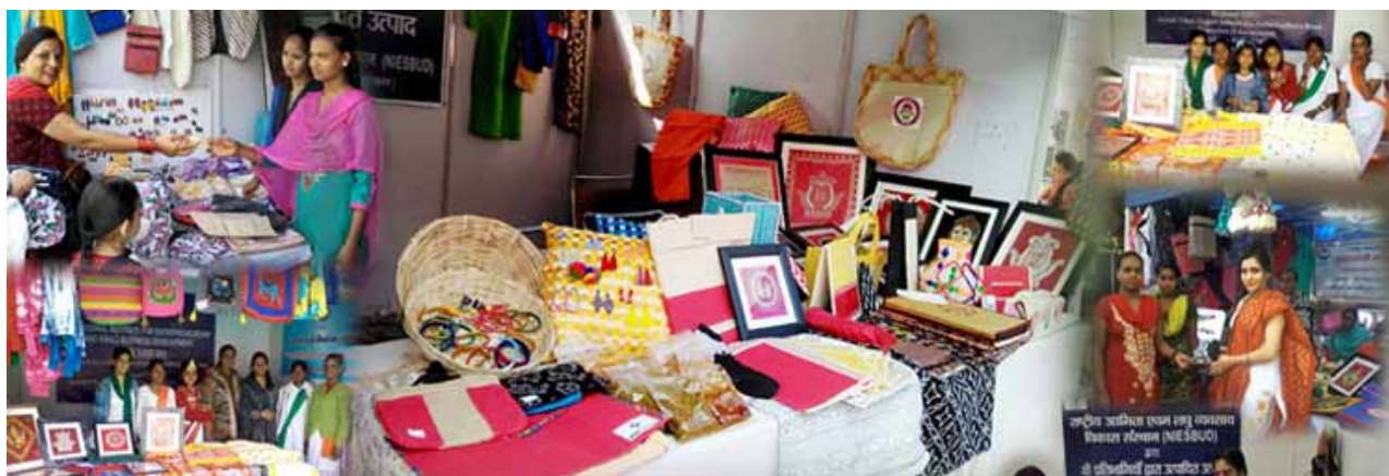
The Products of NIESBUD Trainees being displayed during Exhibition-cum-Sale