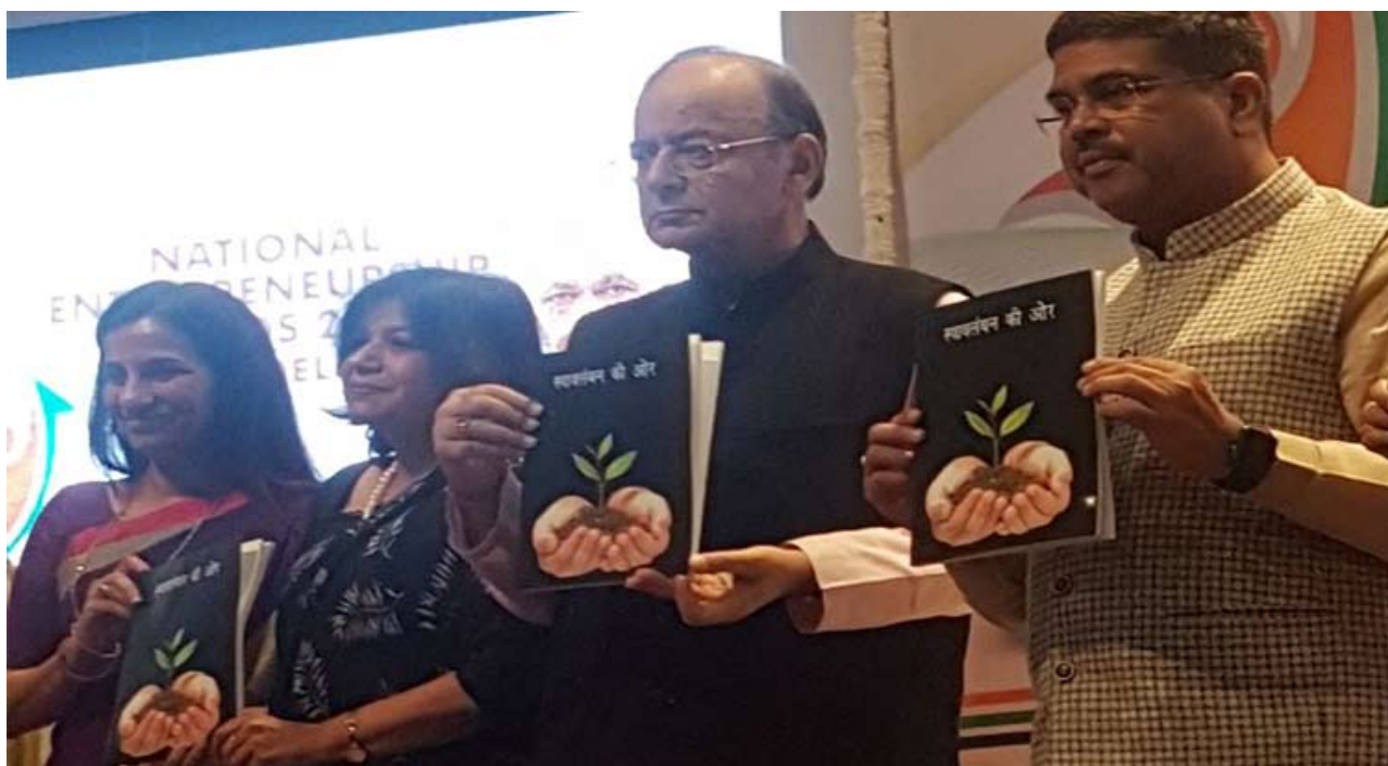
नई दिल्ली में “स्वावलंबन की ओर” का विमोचन