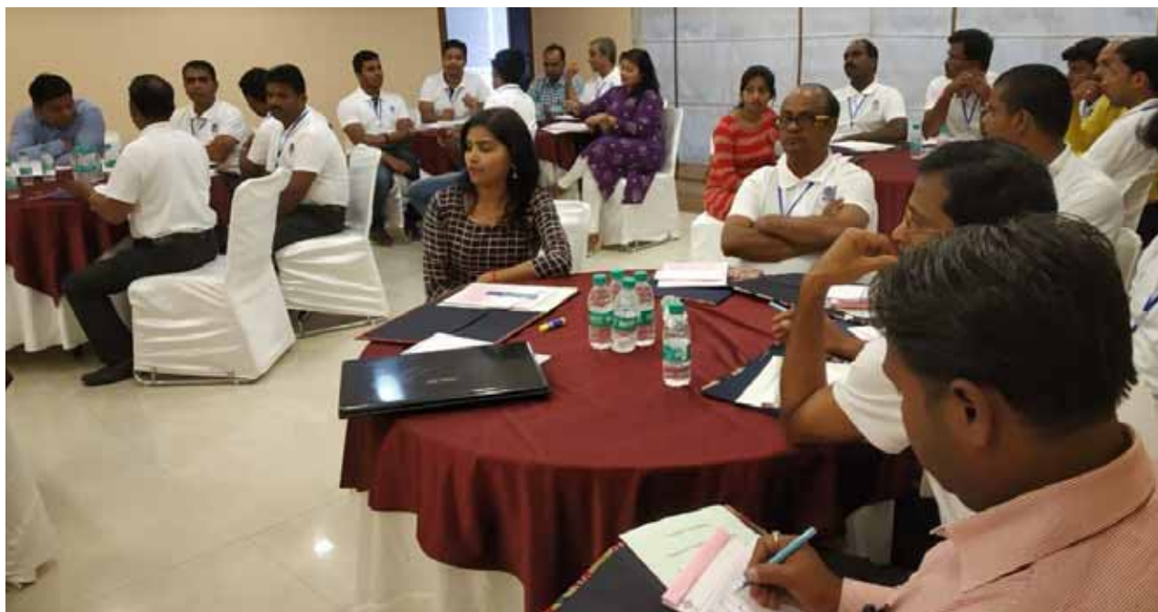
The Faculty of ITIs at Trainers' Training Programme