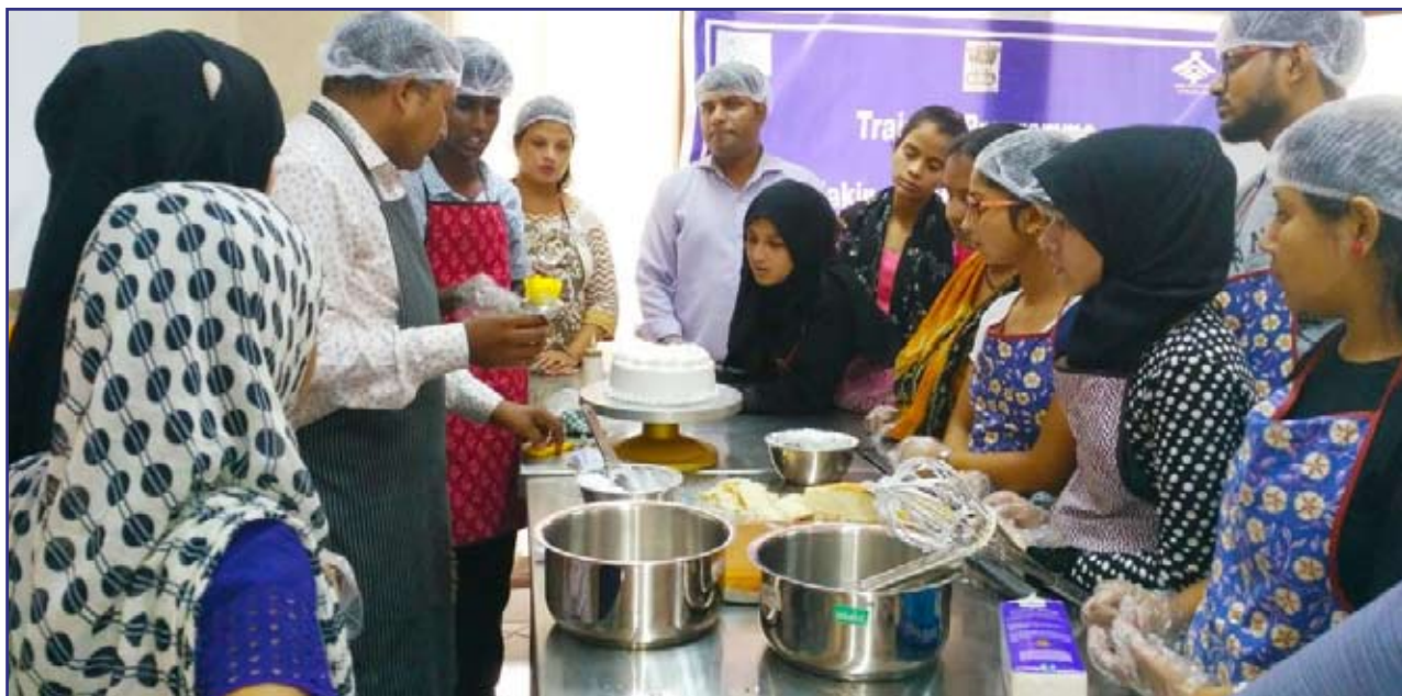
खाद्य प्रसंस्करण इंक्यूबेटर में केक-मेकिंग का अभ्यास

इन इंक्यूबेटर्स को संस्थान के नौएडा, परिसर में स्थापित किया गया है।