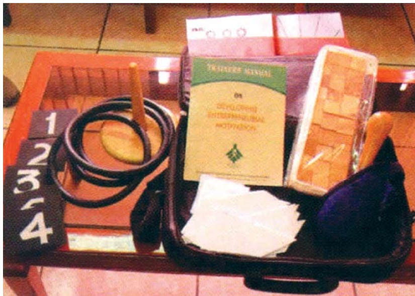
ई एम टी किट

संस्थान, वर्तमान एवं संभाव्य उद्यमियों एवं ईडीपी संगठनों को उनके विविध कार्यकलापों में सलाह एवं परामर्श प्रदान करता है। अतः यह समाज में उद्यमिता के उन्नयन/विकास को बढ़ावा देता है। इस वर्ष में संस्थान के मार्गदर्शन से 500 से अधिक वर्तमान संभाव्य उद्यमियों, विकास संगठनों संस्थानों को लाभ प्राप्त हुआ। इनमें से अधिकांश उन उद्यमियों को मार्गदर्शन दिया जो अपने स्वयं के आर्थिक व्यवसाय प्रारम्भ करने में तीव्र रुचि दिखा रहे थे।