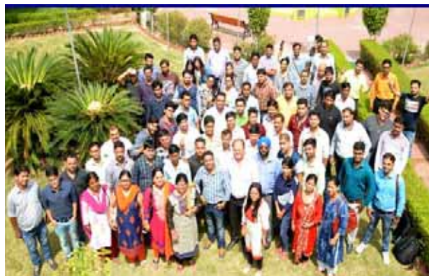
The Participants of Training Programme on Social Media Marketing

NIESBUD also organized six (06) training programmes on "Social Media Marketing" in which total one hundred twenty four (124) candidates were trained. These programmes were organized between May 2017 to September 2017.