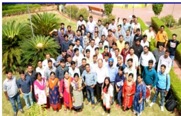
सोशल मीडिया मार्केटिंग के प्रशिक्षण कार्यक्रम के प्रतिभागी

निसबड ने छः (06) प्रशिक्षण कार्यक्रम "सामाजिक मीडिया मार्केटिंग" पर भी आयोजित किए जिसमें कुल एक सौ चौबीस (124) प्रत्याशियों को प्रशिक्षित किया गया। ये कार्यक्रम मई 2017 से सितम्बर 2017 के मध्य आयोजित किए गए।