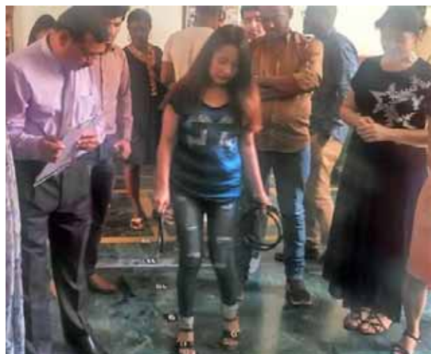
Undertaking Entrepreneurial Motivation Exercise, Ring Toss, are the International Participants of the Institute