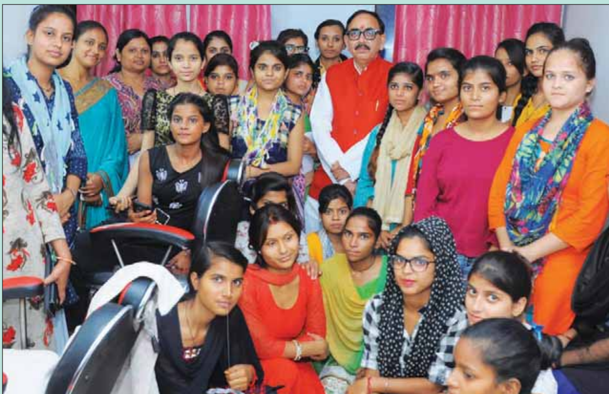
Dr. Mahendra Nath Pandey, Hon'ble Union Minister of Skill Development and Entrepreneurship, seen with beneficiaries of Beauty & Wellness LBI at Campus of the Institute