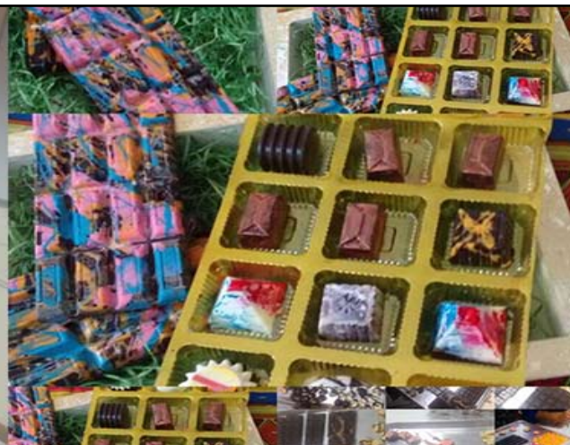
प्रतिभागियों द्वारा चाकलेट मेकिंग