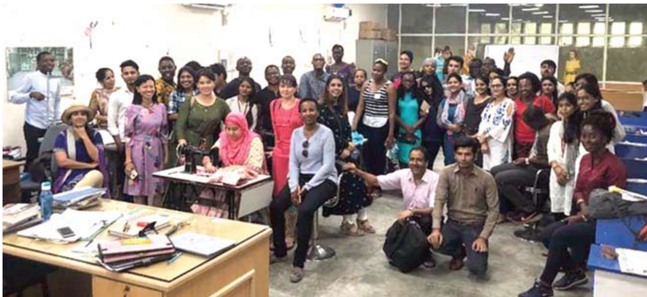
फील्ड विजिट्स के दौरान एनएसआईसी, नई दिल्ली में अन्तर्राष्ट्रीय प्रतिभागी

पेशेवरों की योग्यता में वृद्धि करने के मूल उद्देश्य से आयोजित किया गया। प्रतिभागियों ने बोटम लाईन तथा टॉप लाईन में प्रत्यक्ष प्रभाव को भी सीखा।