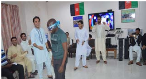
परिसर में अन्तर्राष्ट्रीय प्रतिभागियों द्वारा "अफगानिस्तान दिवस" मनाया गया

संस्थान ने 03 जुलाई से 12 अगस्त 2017 तक जल-आपूर्ति एवं स्वच्छता विकास (डब्ल्यूवाईईडब्ल्यूएसडी) में महिला एवं युवा उद्यमिता पर छह सप्ताहों का अन्तर्राष्ट्रीय प्रशिक्षण कार्यक्रम आयोजित किया, जिसमें 14 पदाधिकारी उपस्थित रहे। यह कार्यक्रम विकासशील देशों में महिलाओं एवं युवाओं के नेतृत्व में तुल्य विकासात्मक परियोजनाओं में विकास, स्वच्छता एवं आरोग्यता कार्यक्रम प्रबंधन में सूक्ष्म, मध्यम एवं लघु उपक्रमों में विविध प्रकार की सहभागिता में प्रतिभागियों के लिए सुगम्य बनाने हेतु आयोजित किया गया।