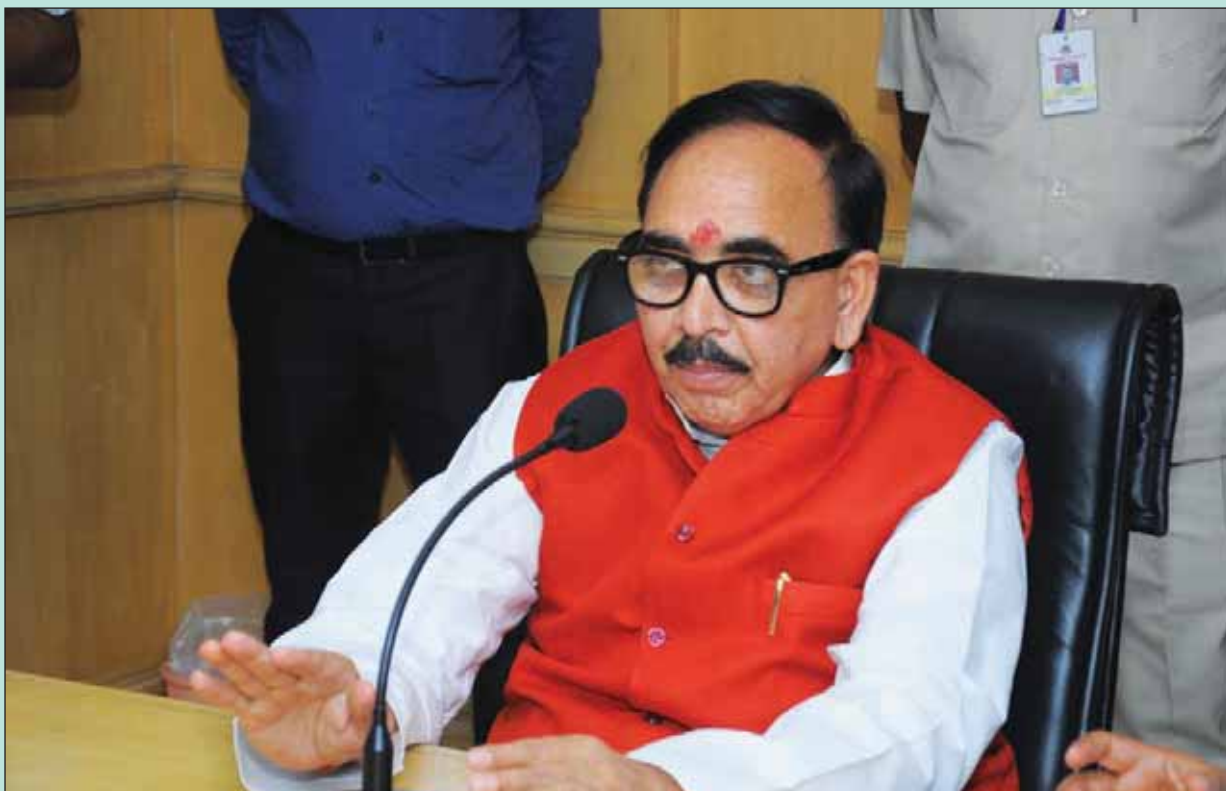
Dr. Mahendra Nath Pandey, Hon'ble Union Minister of Skill Development and Entrepreneurship making a point in course of interaction with the Participants of a Training Programme during visit to NOIDA Campus of the Institute