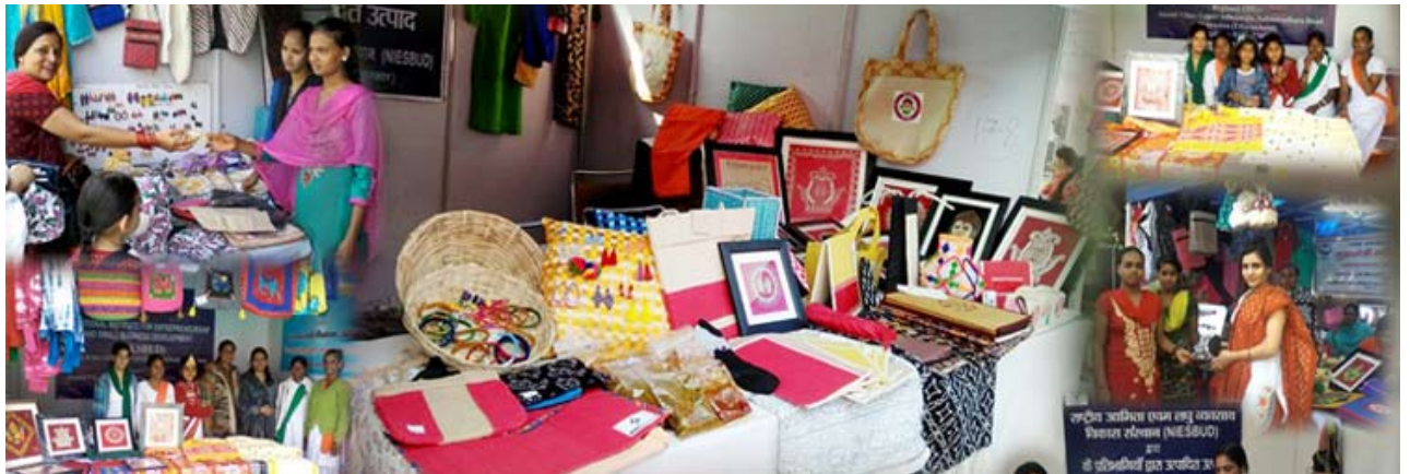
प्रदर्शनी-सह-विक्री में निसबड प्रशिक्षणार्थियों के उत्पादों का प्रदर्शन