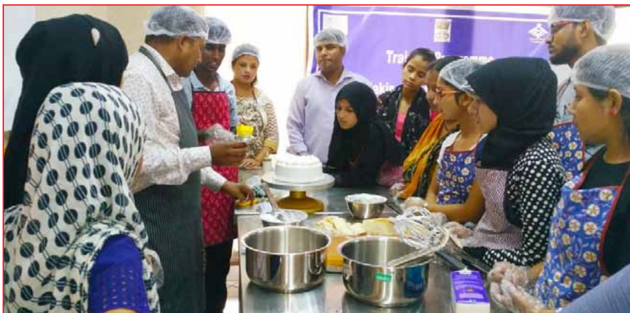
Cake Making being practiced at Food Processing LBI

The Institute has set up these LBIs at its NOIDA, Campus.