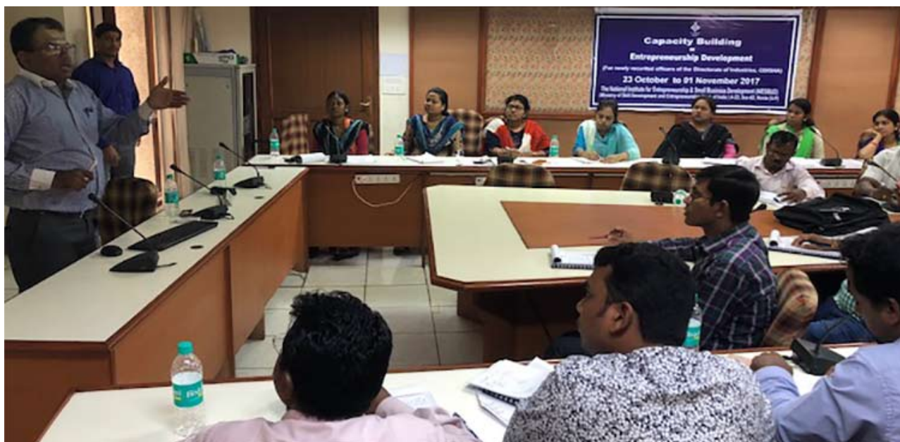
क्षमता निर्माण पर प्रशिक्षण कार्यक्रम के प्रतिभागी