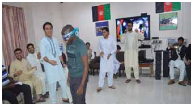
The "Afghanistan Day" being celebrated by International Participants at the Campus

The Institute organized six-weeks' International Training Programme on Women and Youth Entrepreneurship in Water Supply and Sanitation Development (WYEWSD) from 3rd July – 12th August 2017 which was attended by 14 officials. The programme was organized to expose the participants to wide range participation of Micro, Medium and Small Enterprises in the development of water; sanitation and hygiene programmes management of similar projects in developing countries and promoting women and youth led entrepreneurship in similar developmental projects.