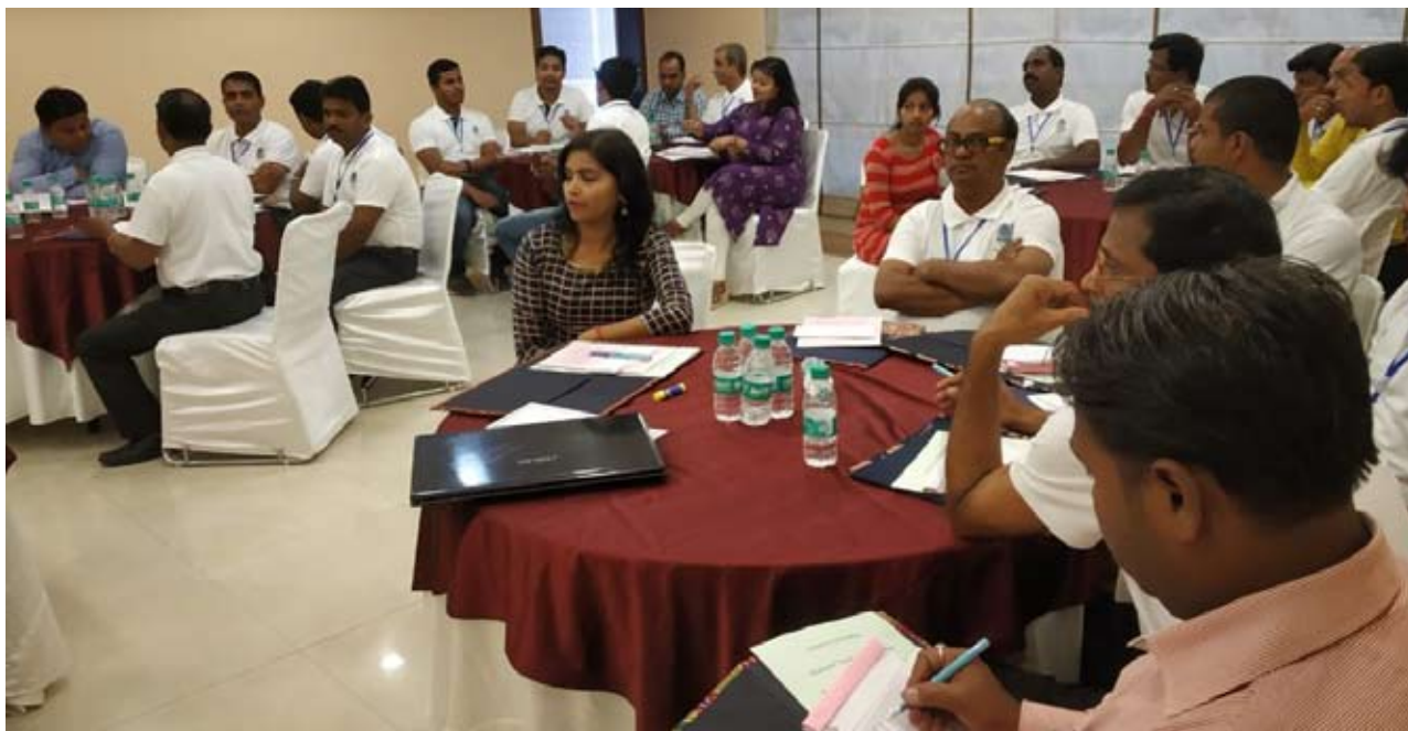
आईटीआई के संकाय, प्रशिक्षकों का प्रशिक्षण कार्यक्रम के दौरान

वर्ष 2017-18 में उत्तराखण्ड सरकार के केवीआईसी अधिकारियों के लिए निसबुड क्षेत्रीय कार्यालय ने एक (1) एमडीपी आयोजित किया। इस प्रशिक्षण कार्यक्रम में तेरह (13) प्रशिक्षणार्थियों ने भाग लिया। यह कार्यक्रम केवीआईसी, उत्तराखण्ड सरकार द्वारा प्रायोजित था। इस प्रशिक्षण कार्यक्रम का मुख्य उद्देश्य केवीआईसी के अधिकारियों के मध्य कार्य-संस्कृति के बदलते परिदृश्य के अनुसार, तकनीकी और अधिकारिक प्रबंधन कौशल विकसित करना और बढ़ाना था। इससे अधिकारियों को कार्य के बदलते वातावरण के अनुकूल होने में मदद मिलेगी।