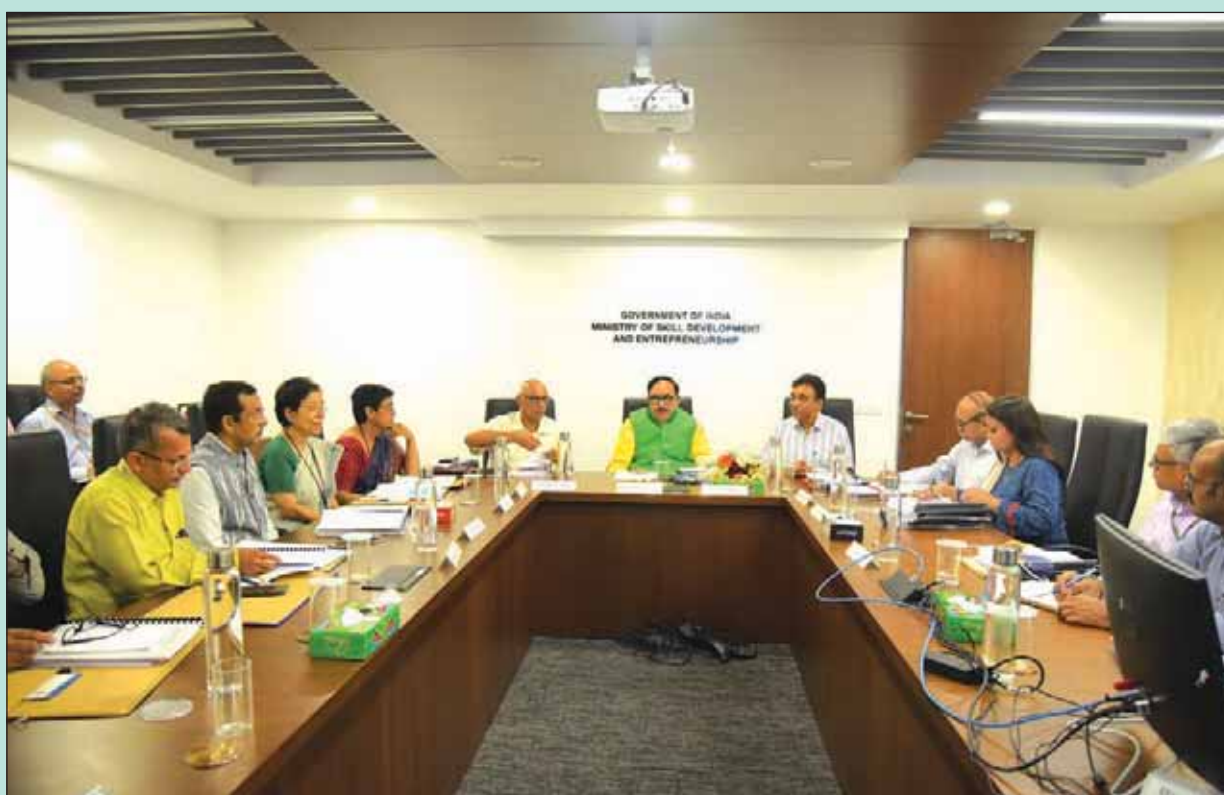
The Meeting of Governing Council in progress