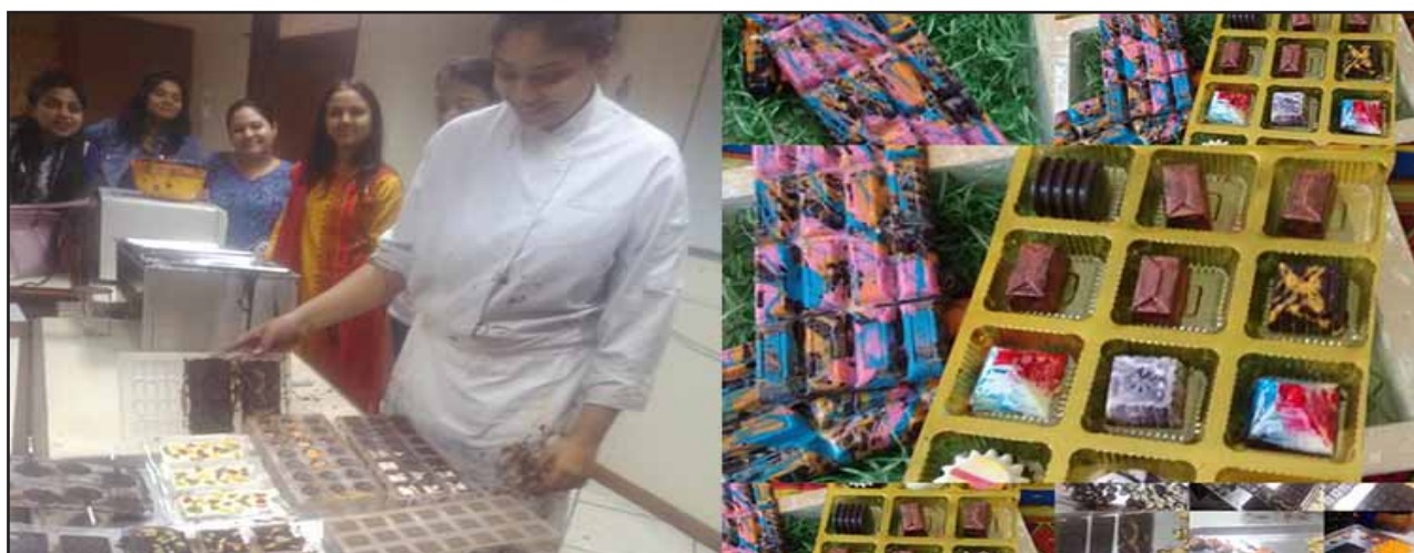
Chocolate Making by the Participants

NIESBUD has organized International Trainers Training on Promotion of Self Employment and Skill Development (TT-PSESD) from March to April 2018, which was attended by thirty-five (35) participants from various countries. The main objectives of the programme are to understand the Process of Entrepreneurship Development for Self-Employment & Skill Development, develop skill in sensing and selecting appropriate project, understand the institutional networking for self-employment & skill development and acquire ability and capability for setting up an enterprise and to manage it successfully.