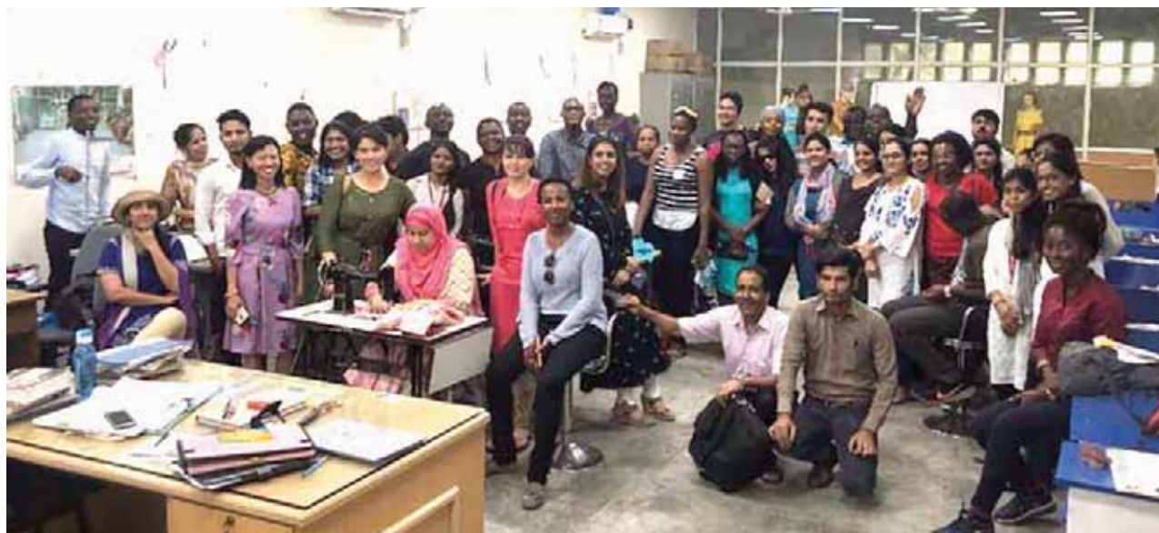
The International Participants at NSIC, New Delhi, during course of Field Visits

through increased profitability and increased opportunity mining across projects/accounts/sectors.