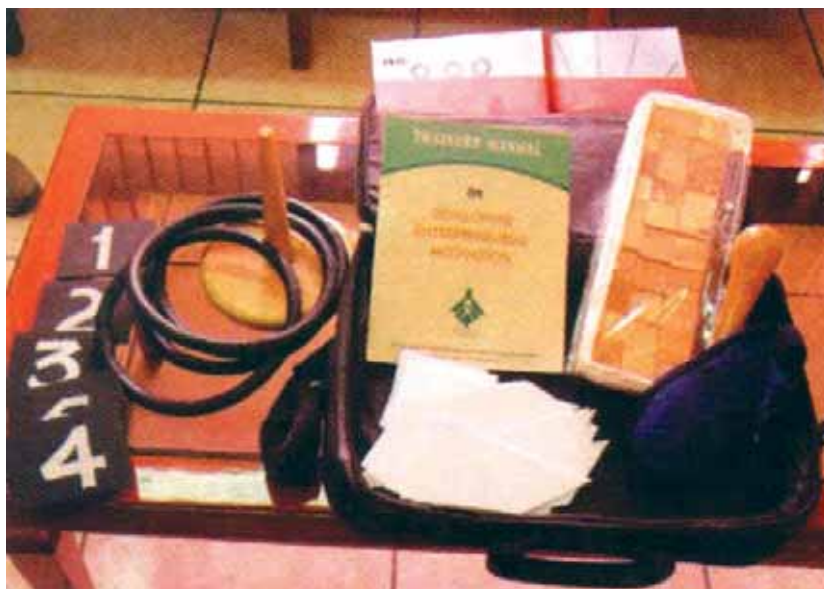
The EMT Kit

The Institute has been providing advice and consultancy to existing and potential entrepreneurs and EDP organizations in their multi-faceted activities. It thus helps the cause of promotion/development of entrepreneurship in the society. The year saw more than five hundred existing/potential entrepreneurs; developmental organizations/institutes being benefited from the guidance provided by the Institute. The majority of potential entrepreneurs guided, evinced keen interest in commencing their own economic ventures through these bodies/agencies.