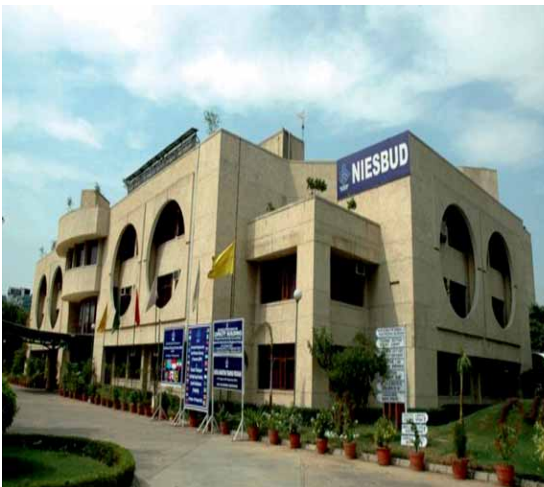
The NOIDA Campus

1.8 The Institute is operating from an integrated Campus in Sector-62, NOIDA, NCR of Delhi and its regional office at DEHRADUN. Main Campus at NOIDA is about 20 kms from the city center of Delhi. The campus is spread in an area of 10,000 sq. meters with about 60,000 sq. feet of built up area. It has eight class rooms, 1 auditorium, and 1 conference hall, besides a library, a hostel with 32 twin-sharing rooms and other facilities.