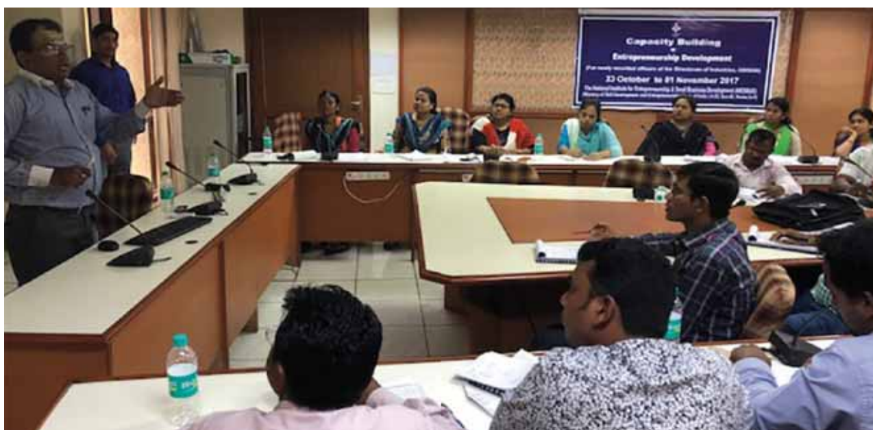
The Participants of Training Programme on Capacity Building