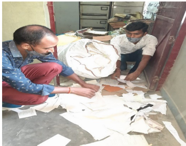
Glimpse of record management & weeding out of papers.