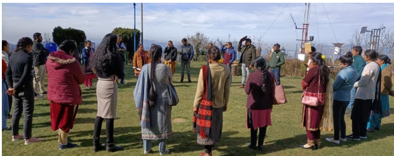
Micro Lab session during Trainers Training Programme on Employability, Entrepreneurship and Life Skills for the JSS trainers at Shimla, Himachal Pradesh