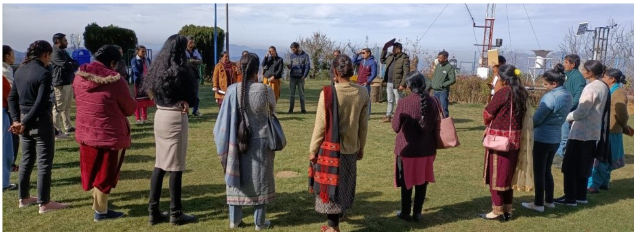
शिमला, हिमाचल प्रदेश में जन शिक्षण संस्थान (जेएसएस) के प्रशिक्षक प्रशिक्षण के लिये रोजगार कौशल, उद्यमिता और जीवन कौशल पर आयोजित प्रशिक्षक प्रशिक्षण कार्यक्रम के दौरान माइक्रो लैब सत्र