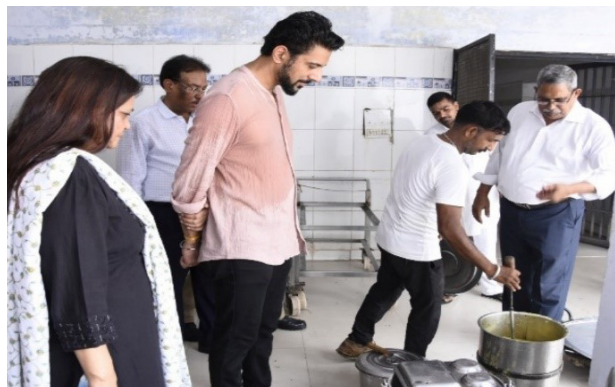
Master Chef Ranveer Brar sharing his experience on food processing with the jail inmates of Adarsh Karagar, Lucknow

Incubation Centre at Jails of Uttar Pradesh" with the support of Ministry of Skill Development and Entrepreneurship, for creating, fostering and promoting the spirit of entrepreneurship among the Jail Inmates through Capacity Building, Mentoring, Handholding and Incubation Support. The project is being implemented in Nari Bandi Niketan, Lucknow, Model Jail, Lucknow and Central Jail, Varanasi.