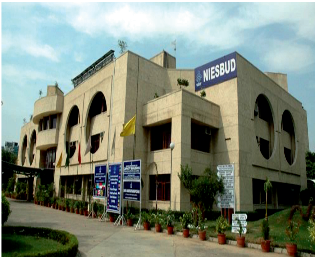
The NOIDA Campus

about 20 Kms. from the city center of Delhi. It is established in the area of 10,000 sq. meters with about 60,000 sq. feet of built up area. It has 8 class rooms, 1 auditorium, and 1 conference hall besides library, 32 twin sharing rooms hostel and other facilities.