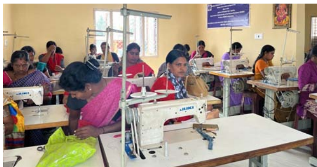
Entrepreneurship and Skill Development Programmes (ESDP) sponsored by National Schedule Caste Finance and Development Corporation (NSFDC) at Mysore, Karnataka.

The Institute has conducted 196 Entrepreneurship cum Skill Development Programmes, Entrepreneurship Development Programmes and Upskilling Programmes under National Scheduled Castes Finance and Development Corporation (NSFDC) in which 4924 participants were trained respectively at different locations in the States of Andhra Pradesh, Bihar, Chhattisgarh, Delhi, Gujarat, Haryana, Himachal Pradesh, Jammu & Kashmir, Karnataka, Kerala, Madhya Pradesh, Odisha, Punjab, Rajasthan, Tamil Nadu, Telangana, Uttar Pradesh, Uttarakhand & West Bengal. The programmes were conducted on the job roles of Assistant Electrician, Domestic Data Entry Operator, Mobile Phone Hardware Repair, Plumber, Self Employed Tailor, Spice Processing Technician & Fitter Electrical Assistant. The target beneficiaries were from the Scheduled Caste Category.