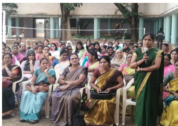
Inauguration of Training of Trainers Programme on Employability, Entrepreneurship and Life Skills for Trainers of Jan Shikshan Sansthan (JSS) at Bangalore, Karnataka

The Institute has organised 56 ToTs under the initiative and imparted training to 1667 JSS trainers and the EDP among 310 trainees of JSS. The details of ToTs and EDPs conducted under the project is as given below: