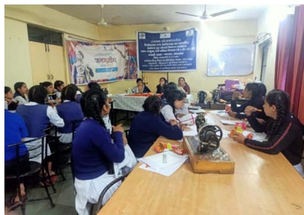
Entrepreneurship cum Skill Development Programme (ESDP) under SANKALP, MSDE for girls from Kasturba Gandhi Balika Vidyalaya, (KGBV) at Chakrata, Uttarakhand

Under this Scheme, the Institute has imparted training to 21073 beneficiaries in Financial Year 2022-23. The activity wise status of the programmes is given below: