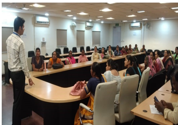
Entrepreneurship Development Programme under SANKALP, MSDE at Delhi

The Institute under Skill Acquisition and Knowledge Awareness for Livelihood Promotion (SANKALP) Scheme of the Ministry of Skill Development and Entrepreneurship (MSDE) is implementing a project for strengthening the entrepreneurship ecosystem of different marginalized sections of the society. Under this initiative, NIESBUD will train a total of 24,600 beneficiaries. The project aims at creating, fostering and promoting the spirit of entrepreneurship among the various target groups through Capacity Building, Incubation Support, Mentoring and Handholding.