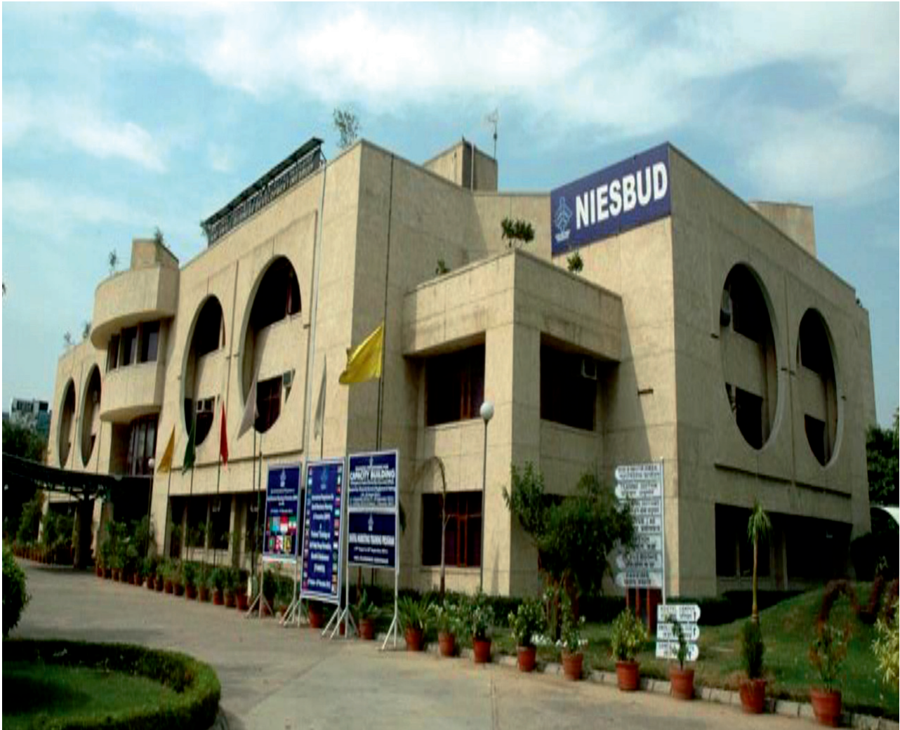
निसबड परिसर, नोएडा

एक ऑडिटोरियम एवं एक सम्मेलन हॉल के अलावा पुस्तकालय, ट्यून-शेयरिंग के 32 कमरे एवं अन्य सुविधाएं उपलब्ध हैं।