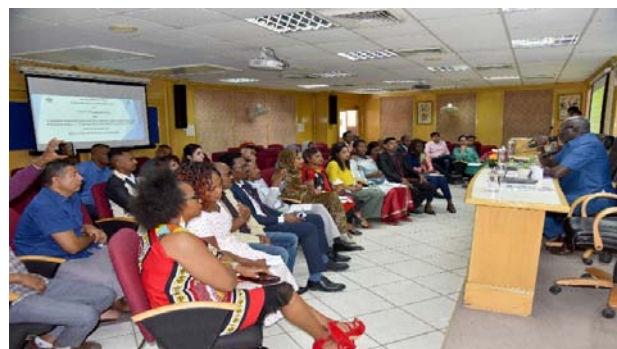
The Valedictory function of International Training Programme on Cluster Development for Rural and Traditional Enterprise Trainers/Promoters at NIESBUD, NOIDA.

Enterprises- Trainers/Promoters Programme and one programme on International Trade: Export Import Procedure and Documentation through physical and online modes. A total number of 183 participants attended the programmes.