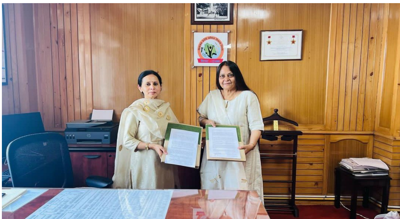
MoU exchange between NIESBUD and Himachal Pradesh Kaushal Vikash Nigam