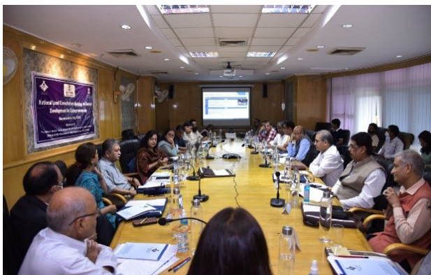
नोएडा में उद्यमिता के लिए सामग्री विकास पर राष्ट्रीय स्तर की परामर्श कार्यशाला।

निसबुड ने कौशल विकास और उद्यमशीलता मंत्रालय के सहयोग से सरकार द्वारा उनके विभिन्न उद्यमिता विकास कार्यक्रमों में उपयोग किए जाने वाली उद्यमिता शिक्षा पर पाठ्यक्रम का विकास कर रहा है जिससे उद्यमिता विकास में समानता एवं मानकीकरण किया जा सके और शिक्षण परिणाम मापनीय हों।