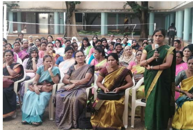
बैंगलुरु, कर्नाटक में जन शिक्षण संस्थान (जेएसएस) के प्रशिक्षकों के लिये नियोजनिता, उद्यमिता और जीवन कौशल पर आयोजित प्रशिक्षक प्रशिक्षण कार्यक्रम का उदघाटन