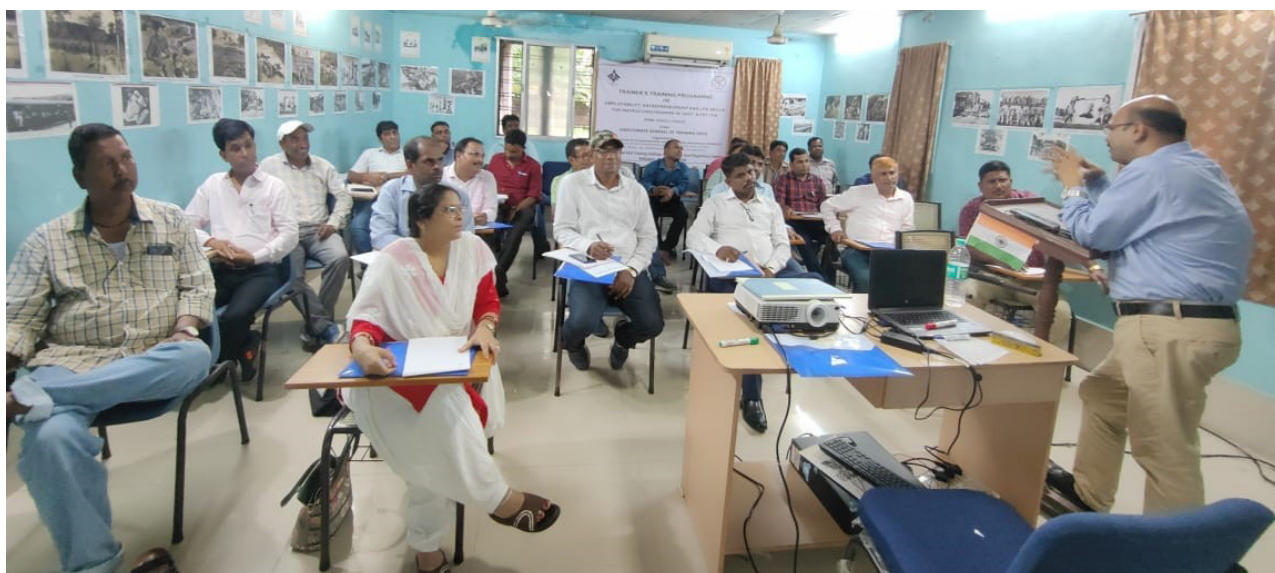
Session on Procedure and formalities for Bank Finance during Training of Trainers Programmes.