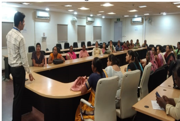
संकल्प, एमएसडीई के अन्तर्गत दिल्ली में आयोजित उद्यमिता विकास कार्यक्रम