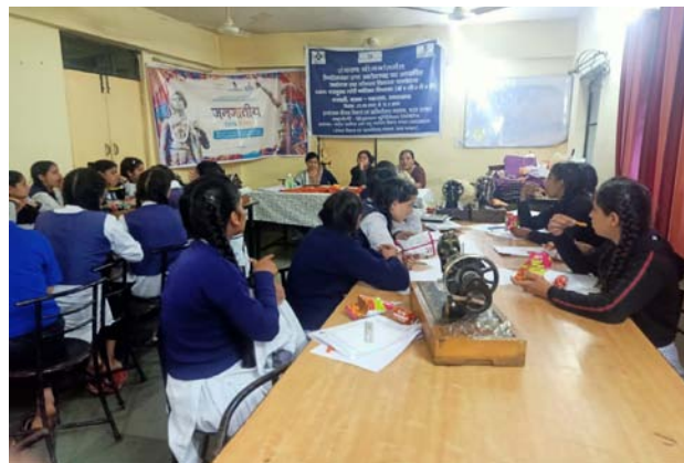
कस्तूरबा गांधी बालिका विद्यालय (केजीबीवी), चकराता, उत्तराखंड के लिए संकल्प एमएसडीई के अन्तर्गत आयोजित उद्यमिता-सह कौशल विकास कार्यक्रम (ईएसडीपी)

संस्थान ने वित्तीय वर्ष 2022-23 में 21073 लाभार्थियों को प्रशिक्षण प्रदान किया। इन कार्यक्रमों का कार्यकलाप वार स्थिति नीचे दी गई है:-