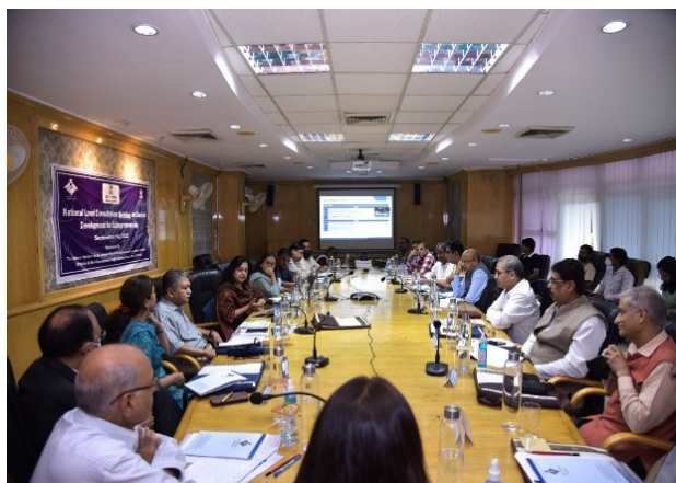
National Level Consultation workshop on content development for entrepreneurship at NIESBUD, Noida.

The purpose of developing the content on Entrepreneurship is to standardize the course on entrepreneurship, so that quality can be maintained in the entrepreneurship development programme throughout the country. The entrepreneurship education content will serve the training requirements of first-generation entrepreneurs including learners of ITIs, Polytechnics, JSS, unemployed youth and community women.