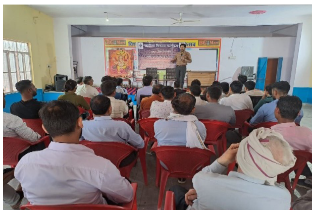
Session on Business Opportunity Identification during EDP pilot project at Dausa, Rajasthan

The Institute is implementing a Pilot Project for Entrepreneurship Development Program in 10 States supported by the Ministry of Skill Development and Entrepreneurship which aims at creating, fostering and promoting the spirit of entrepreneurship among the target groups through Entrepreneurship Development Programme, Mentoring and Handholding support.