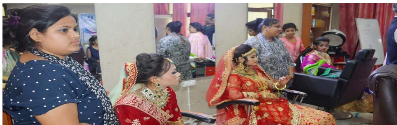
Participants of Beauty & Wellness Incubation Centre at NIESBUD, NOIDA

The above programmes were conducted in the area of Entrepreneurship cum Skill Development Programme (ESDP) on Self Employed Tailor, Assistant Beauty Therapist, Baking Technician, Handset Repair Engineer and Repairing of Home Appliances etc. as per the approval of MSDE.