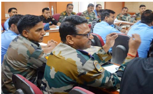
The Participants interacting with successful entrepreneurs during Entrepreneurship Development Programme under Directorate General Resettlement & Training at NIESBUD, Noida.

The Directorate General Resettlement (DGR), Ministry of Defence assists Ex-Servicemen to train and acquire additional skills and facilitate their resettlement through a second career. The Institute conducted 14 programmes for