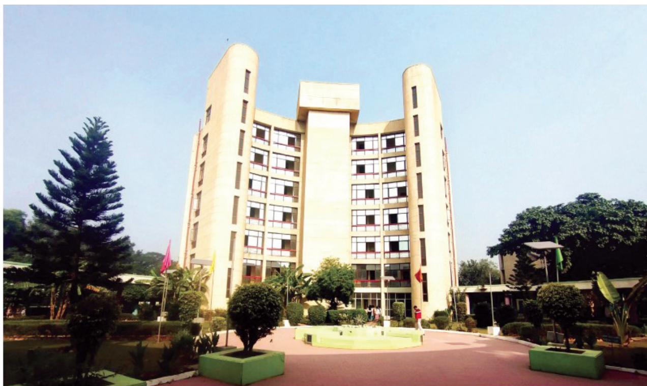
छात्रावास खण्ड, निसबड, नोएडा